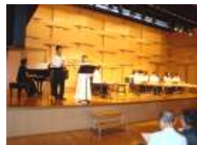
最後に出演者全員と会場の 皆さんで『花は咲く』の合唱

洋楽器・和楽器・ユニークな創作楽器と幅の広い演奏で、 とても楽しいコンサートでした。最後に『花は咲く』を 合唱し、東日本大震災からの1日も早い復興を願いまし た。皆様のご厚意で112365円もの寄付金が集まり ました。ホール使用料を差し引いて、南三陸町社会福祉 協議会に寄付させていただきます。誠にありがとうございました。