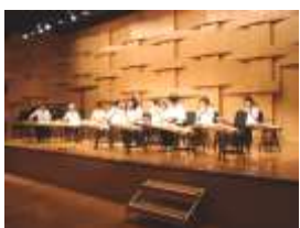
お琴と三味線 白ゆり会の皆さん