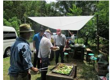
※たけのこクラブ…西宮北部地区にお住いの障がいをお持ちの方の活動団体